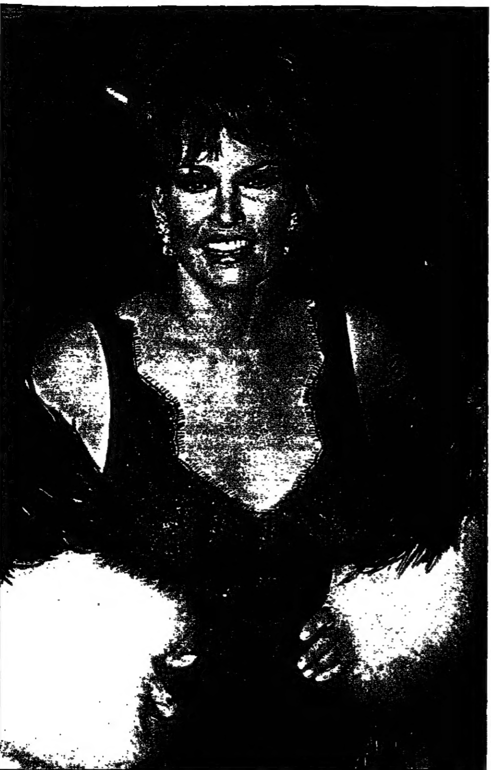
جمعة السينما العالمية رائكلى والش بطلة فيلم «امرأة العالم» وصلت إلى دبيوزعه. حيد تولى بطولة المسرحية المسرحية «فكرت ففكرت»، ابتداء من الليلة على أحد مسارح «ديروادراي».

موسكو - أ ف ب: ذكرت وكالة أنباء إكس-نيتس، وفاة 22 شخصاً في زجاجة فودكا، وآخرين ما زالوا في غرفة الإنعاش. الحادث وقع في مدينة موسكو.